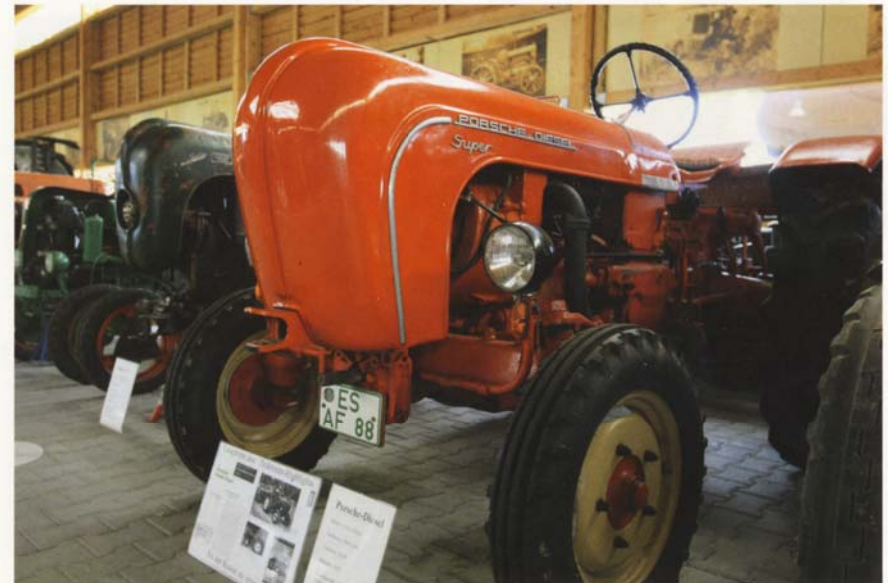
Traktor der Firma Porsche mit 38 PS aus dem Jahr 1959